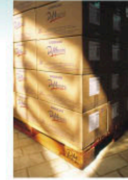
Frutas e Legumes Congelados IQF Fruits and Vegetables