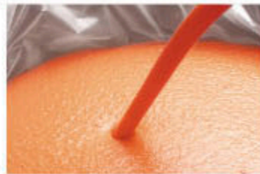
Concentrados Congelados Frozen Concentrates