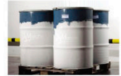
Preparados de Frutas Fruit Preparations