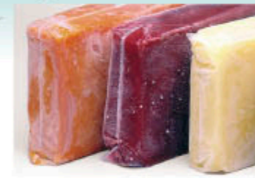
Polpas de Frutas Congeladas Frozen Fruit Purees

De Marchi started its activities in 1942 and it was one of the pioneers in the frozen food market in Brazil. Counting on its own plantations and distribution centers, started the production of frozen fruits in the 1970s, a local novelty back then. De Marchi carried on investing in new technologies, expanding and modernizing its lines, and today offers a wide range of processed products, meeting the quality standards demanded by the major food companies worldwide.